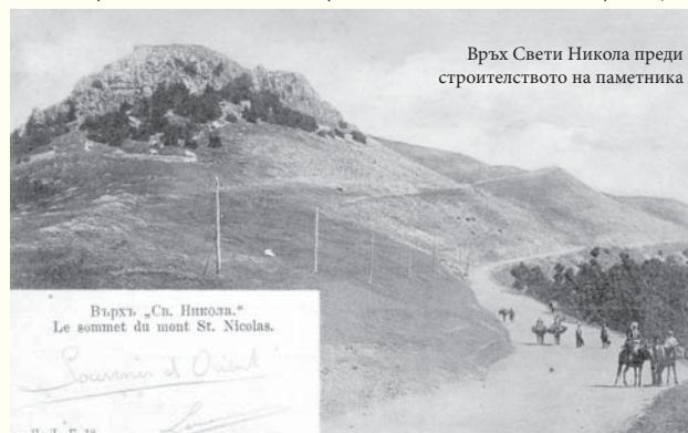
Върх Свети Никола преди строителството на паметника

Важното за мен е, че в тази битка ключова роля изиграва Българското опълчение. От сформираниите шест опълченски дружини в началото на войната, в които са се записали като доброволци „най-лудите глави“, пет участват в отбраната на Шипченския проход. Без да се омаловажава фактът, че