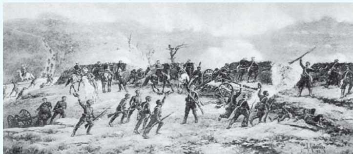
15. Третият бой на Шипченския проваз, 11 Август 1877 г. Le troisième combat sur l'abordage de Shipka, le 11 Août 1877.

Задачата на малобройния руско-български отряд под командването на ген. Николай Столетов, наброяващ около 7 500 души, е да спре неколкотократно превъзхождащата я по чис-